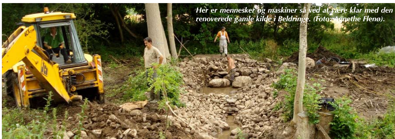
Her er mennesket og maskiner så ved at være klar med den renoverede gamle kilde i Beldringe.