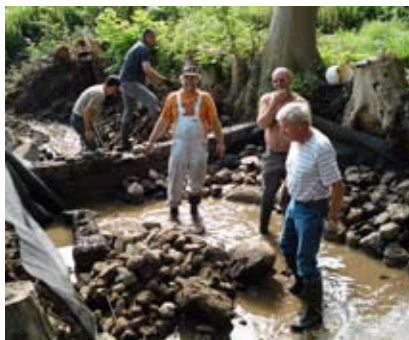
Mændene knokler i mudder og vand for at få lagt stenene på den rigtige måde.

Senere skænkede kong Hans i 1504 også Beldringe kirke til ordenen, og den har sikkert (sammen med kilden)